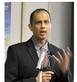
▲ Dr. D'Silva ディシルバ氏

Multicultural/ Multilingual Contexts." He approaches the concept of multiculturalism from the comparative perspective of language assessment methods employed in Asia and North America. He points out however, that one obstacle to widespread use of formative assessments in Asian contexts is the local assessment culture in which summative approaches are believed to be effective among teachers and parents alike due to the examination system, thus suggesting further investigation about how to keep the balance between summative and formative assessment in such Asian contexts where knowledge-based and test-driven teaching and learning are common. Dr. D'Silva presented "Social Inclusion and Exclusion in Multicultural Instructional Contexts: Highlights from Studies with Elementary, Secondary and Post-Secondary ESL Learners in Canadian Schools." He showed the empirical research to investigate the inclusion and exclusion phenomena in multicultural and multilingual school settings. His presentation demonstrated that contributory factors to the inclusion and exclusion of ESL students of Asian culture backgrounds into local Canadian schools are different among elementary, secondary and post-secondary levels.